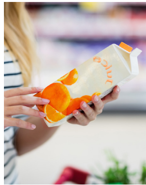
AWP™-DEW: mit EGP